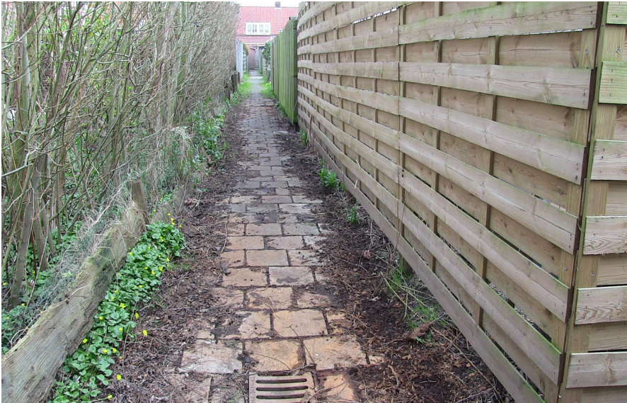
Zomaar een foto van een achterpad.

De meeste achter- en tussen paden zien er beter uit maar laten vaak toch te wensen over. De HVL spreekt regelmatig met de verhuurder af dat sommige paden een opknapbeurt verdienen en vraagt om aandacht. De verhuurder heeft het afgelopen jaar haar goede gezicht laten zien en de paden aangepakt. Maar toch zijn we nog lang niet tevreden en komen nog steeds plekken tegen waar het beter kan. Ook de Gemeente heeft hier een verantwoordelijkheid voor wat betreft het aangrenzende groen. Dit jaar heeft een groep door de gemeente een schouw gelopen. De ploeg bestond uit een afvaardiging van de HVL, de Verhuurder en ook de Gemeente zou aanwezig zijn. Maar door miscommunicatie ging dat even niet door. Men belooft beterschap en het gaat binnenkort nog een keer gebeuren. Dus de wil is er wel en laten we dat stimuleren. Zoals al gemeld heeft de verhuurder een aantal paden een opknapbeurt gegeven en we houden ze er aan dit vol te houden. Het is opgefallen dat bij sommige woningen het overhangend groen hinderlijk aanwezig is en dat de bewoners hierop geattendeerd moeten worden.